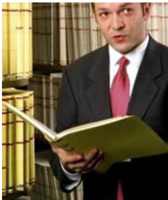
Sok múlik a munkaerő képzettségén (Mfor-montázs)

Míg Magyarországon 2004 és 2006 között mindössze tíz üzleti szolgáltató központ létesült, addig Romániában több mint háromszor, Lengyelországban pedig több mint ötször ennyi. A helyzeten javíthat, hogy - egy friss tanulmány szerint - Budapest mellett néhány vidéki város is kívánatos célponttá válhat ezen a téren. A lehetőségek nagyságát jelzi, hogy Közép- és Kelet-Európa mindössze két-három százalékkal részesedik az üzleti folyamatok kiszervezésének piacából. Mfor.hu tudósítás.